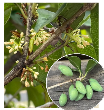
銀木犀が今開花している！ 実が成る！