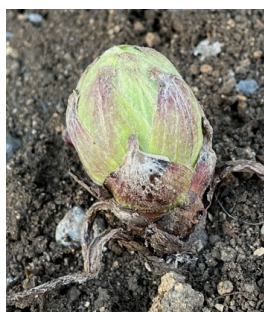
フキノトウ (蔕の臺)