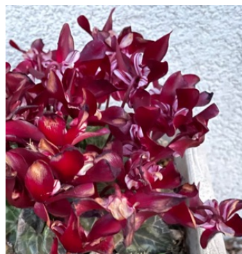
シクラメン? 数ヶ月花が咲き続けている