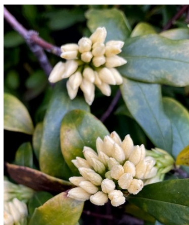
ジンチョウゲ (沈丁花)