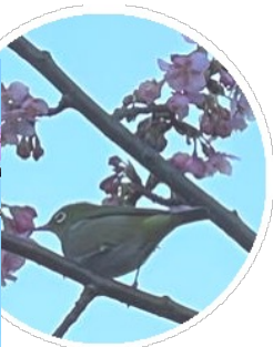
カワズサクラ (河津桜)