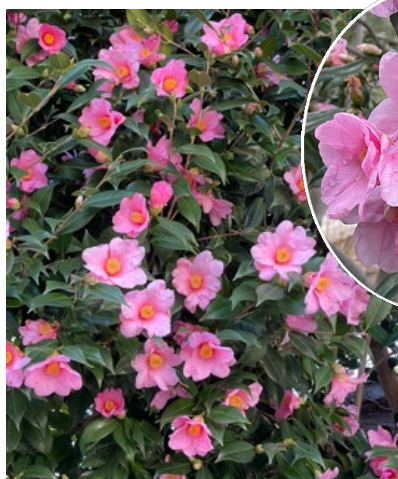
ワビスケツバキ (侘助／太郎冠者)