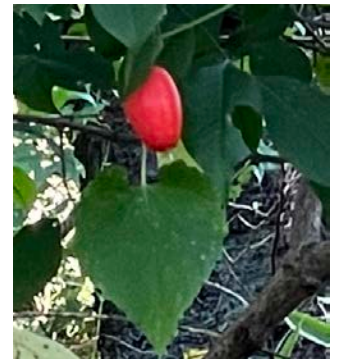
カラスウリ(烏瓜)の実