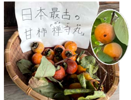
水車小屋の庭の柿