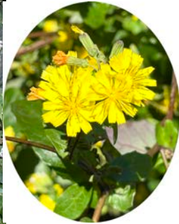
オニタビラコ (鬼田平子)