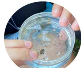
カワゲラ、ウスバカゲロウ