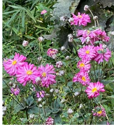
シュメイギク(秋明菊)