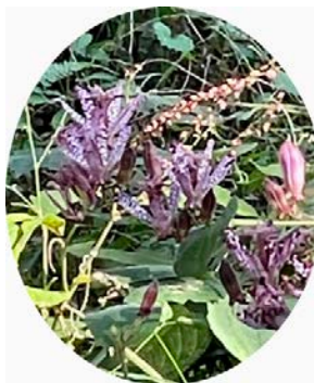
ホトトギス(杜鵑草)