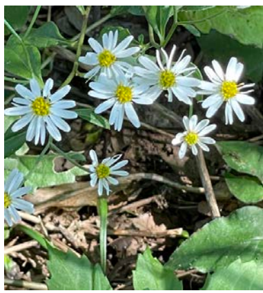
シロヨメナ(白嫁菜)