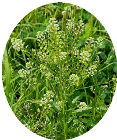
マメゲンバイナズナ (豆軍配薺)