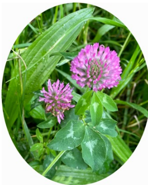
アカツメクサ(赤爪草)