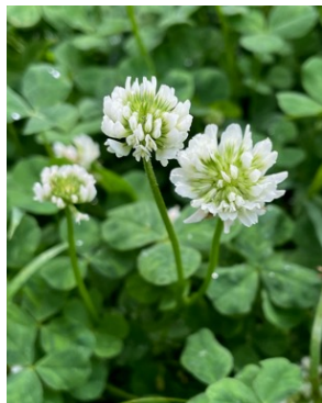
シロツメクサ(白爪草) <クローバー>