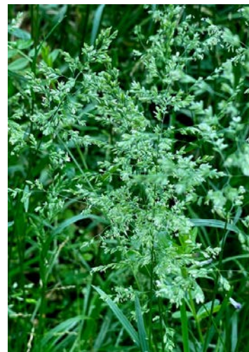
オスズメノカタビラ (大雀の帷子)