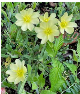
コマツヨイグサ (小待宵草)