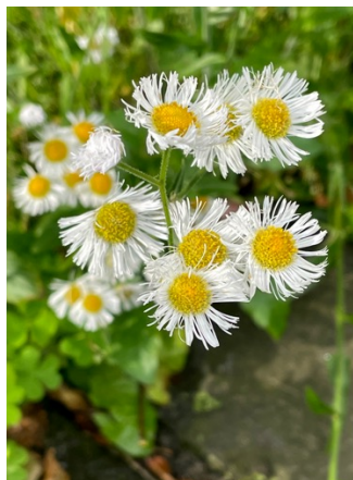
ヒメジオン (姫女菀)