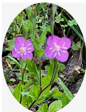
ユウゲショウ(夕化粧)