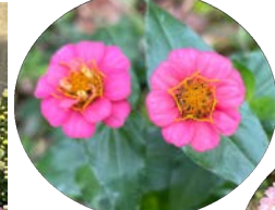
ヒャクニチソウ (百日草)