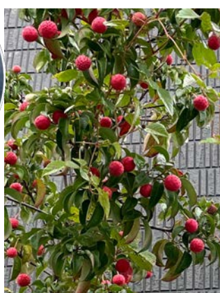
ヤマボウシ (山法師)