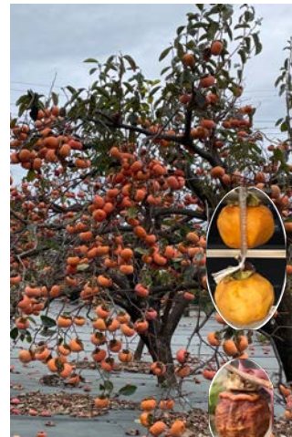
カキ (柿) (干し柿)