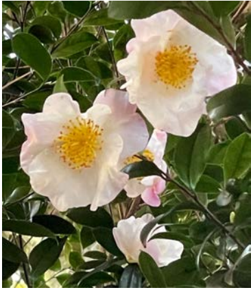
サザンカ (山茶花) 各種