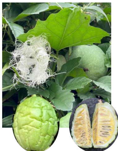
キカラスウリ (黄烏瓜)