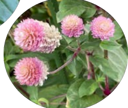
センニチコウ (千日紅)