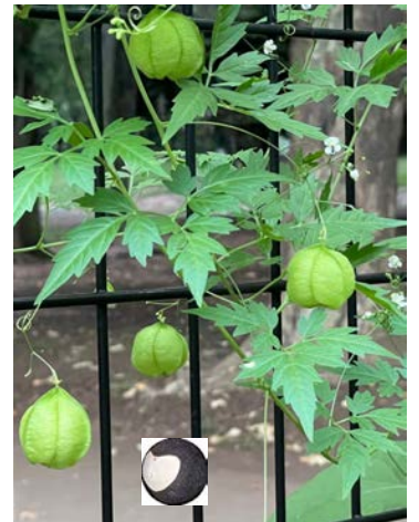
フウセンカズラ (風船葛)