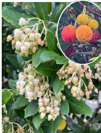
イチゴノキ (莓の木)